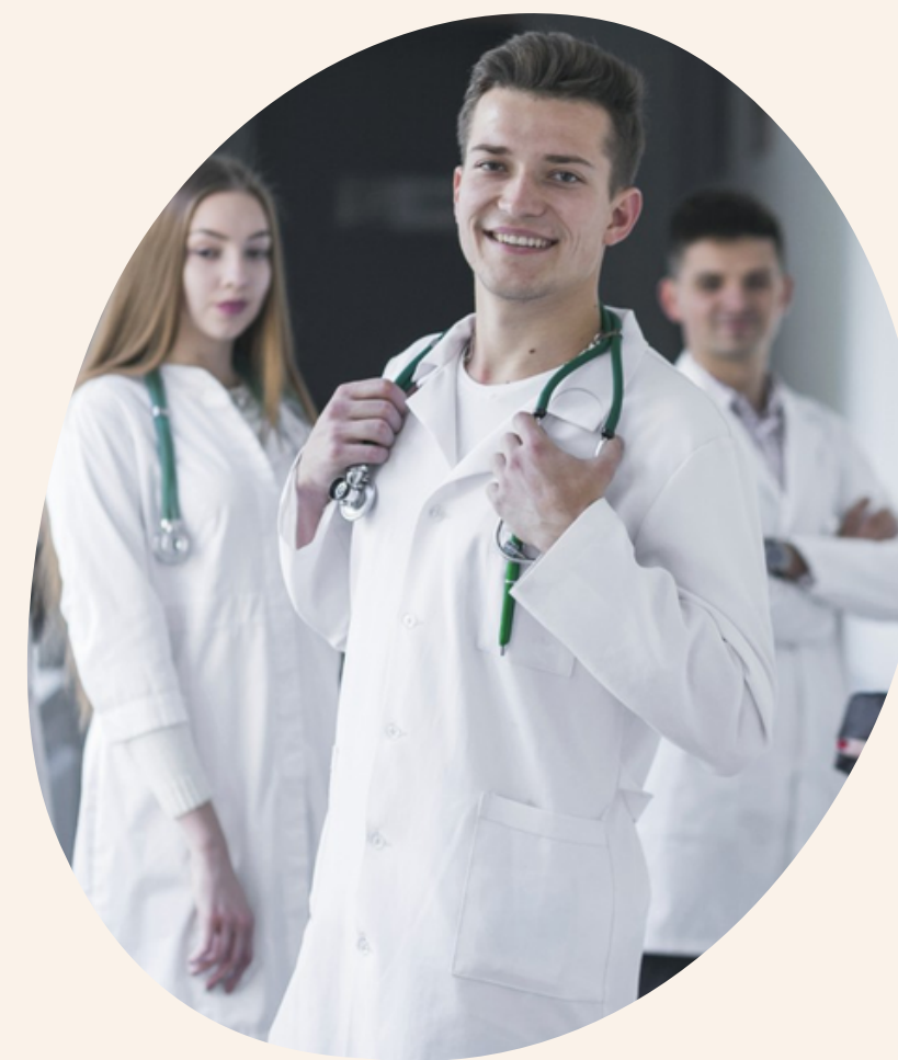
Residentes em psiquiatria para alguns programas e estagiário em psicologia